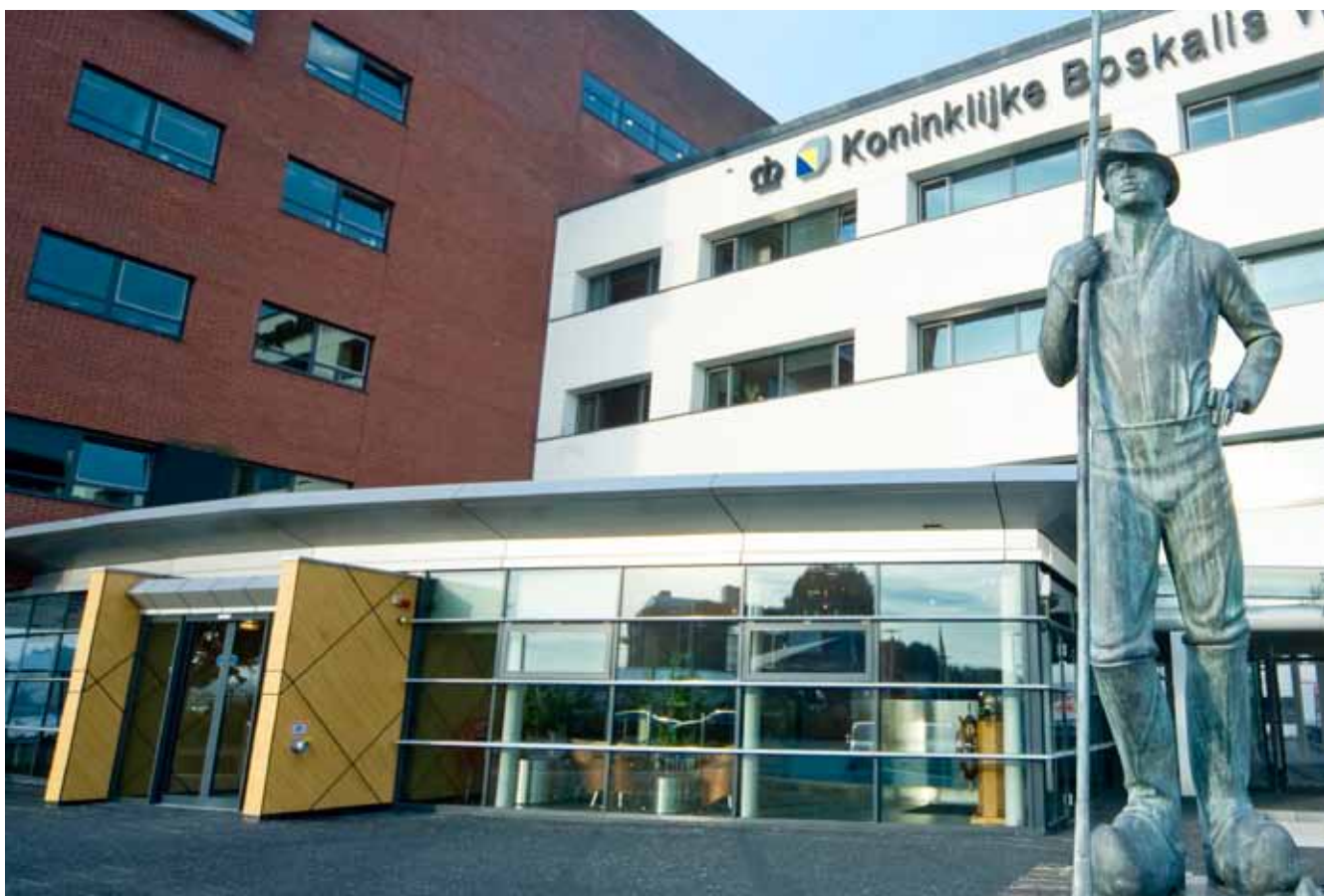
Hoofdkantoor Koninklijke Boskalis Westminster N.V. te Papendrecht.

Gewone aandelen kunnen worden verworven ter beurze of anderszins voor een prijs die ligt tussen één eurocent en tien procent (10%) boven de gemiddelde koers van die aandelen op Euronext Amsterdam op vijf (5) beursdagen voorafgaande aan de verkrijging door of namens de Vennootschap.